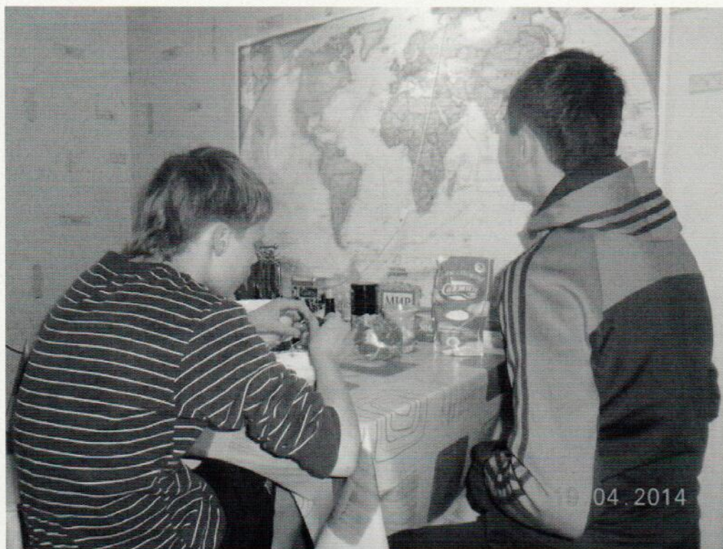
С. и Р. ужинают.