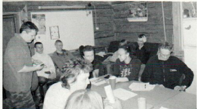
«Планирование жизни» школы не обходится без старшеклассников