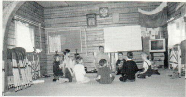
В этой школе учитель не вызывает страха

— Из документов, которые передают из детского дома или приюта, ничего толком не узнаешь. Вот